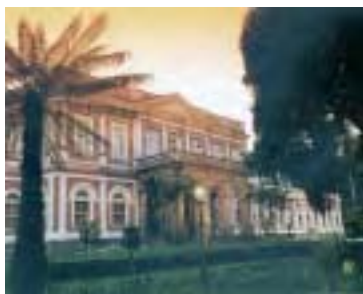
Palácio de Cristal

Arquitetura Francesa, foi presente do Conde D'Eu á Princesa Isabel, em 1879. É uma réplica em miniatura do Crystal Palace (Londres-1851) e abrigava exposições e os Bailes da Monarquia.Estrutura em ferro fundido francês e lâminas de cristal bisotéé .