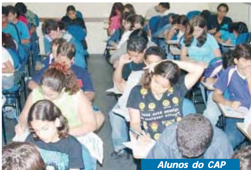
Alunos do CAP

CO. Em 2000 começaram os projetos aos finais de semana. Acreditamos na educação como base pra proporcionar aos alunos, um futuro feliz. Hoje funcionamos em tempo integral oferecendo cursos preparatórios para Marinha, Exército e Aeronáutica, Forças Auxiliares, Vestibulares e Escolas Técnicas.