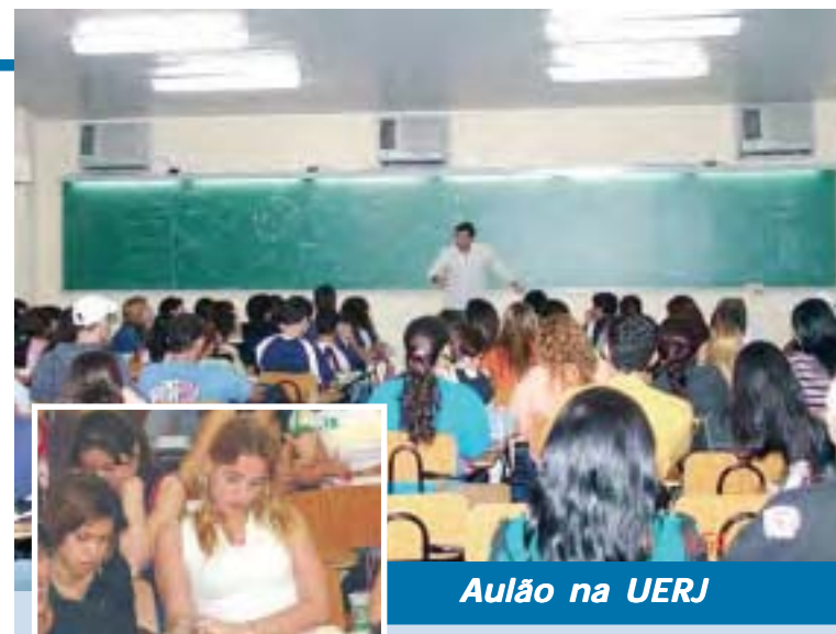
Aulão na UERJ