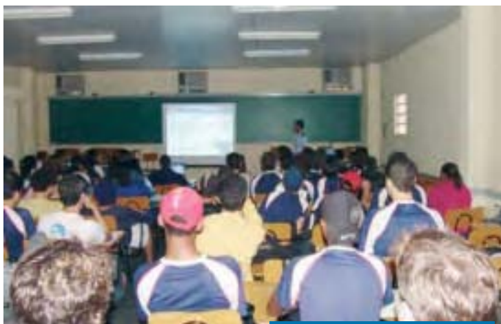
Sala de Aula do CAP

uma visão global do conhecimento com a formação do Colégio, que é voltada para o Vestibular e, no turno da tarde, a preparação específica para os Concursos Militares, independente da série que ele esteja cursando na parte na manhã. Ou seja, o nosso aluno ganha em ambos os aspectos: recebe a preparação específica para o Concurso Militar e garante uma formação global e atualizada do mundo, algo fundamental para um futuro de sucesso.